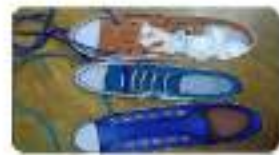
๔.รูปภาพรองเท้า