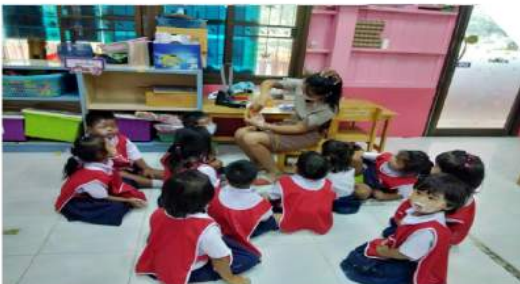
ครูสอนวิธีการร้อยเชือกผูกกรองเท้าให้นักเรียน