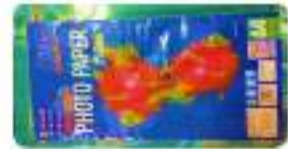
๒.กระดาษโฟโต้