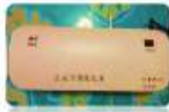
๓.เครื่องเคลือบ