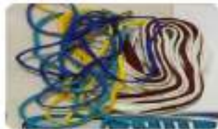
๕.เชือกผูกรองเท้า