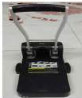
๗.เครื่องเจาะกระดาษ