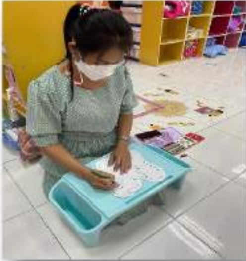
๓.๔.๒ ขั้นตอนการผลิต “ฝึกทักษะการผูก/ร้อยเชือกทรงเท้าสำหรับเด็กปฐมวัย”